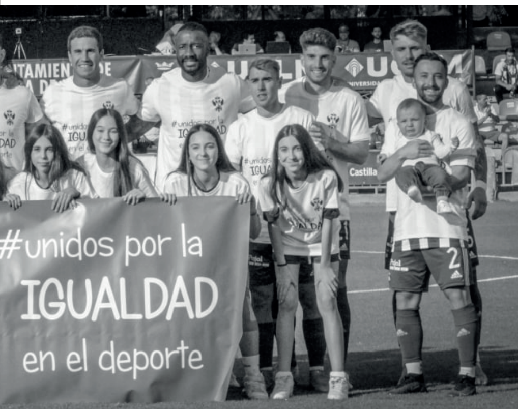
Acto conmemorativo por la igualdad en el deporte

Como firme compromiso, se ha promocionado y dotado de plena visibilidad al fútbol femenino. El CF Talavera es un espacio de igualdad, donde nuestro femenino ha sido referente en nuestra provincia, haciendo una más que notable temporada en Liga Regional.